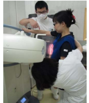
ポジショニング実習