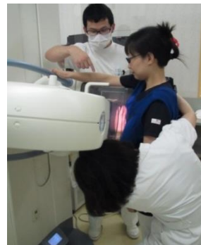
ポジショニング実習