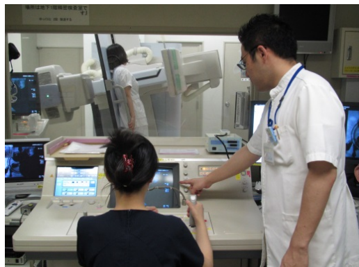
撮影シミュレーションの様子